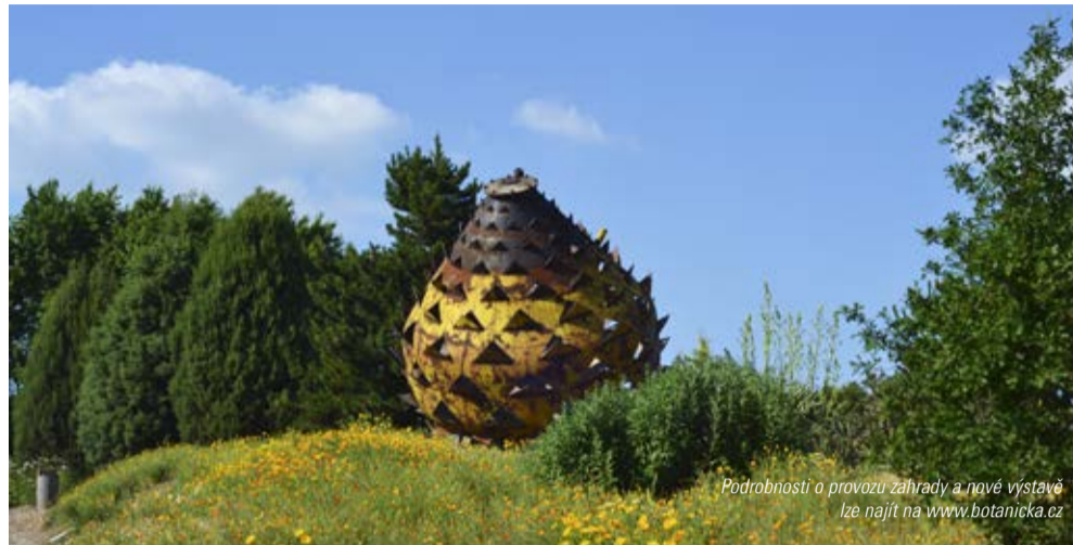
Podrobnosti o provozu zahrady a nové výstavě lze najít na www.botanicka.cz