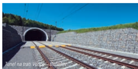
Tunel na trati Votice – Benešov