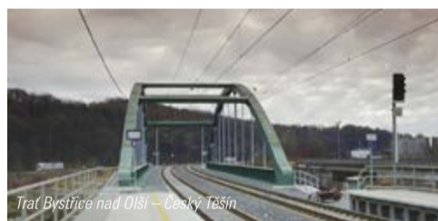
Trat Bystřice nad Olší – Český Těšín