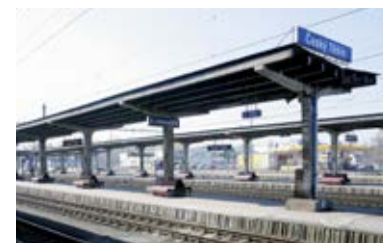
PRÁCE NA ČESKOTĚŠÍNSKÉM NÁDRAŽÍ