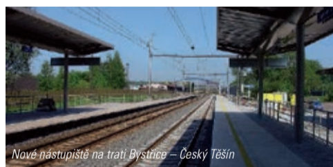
Nové nástupiště na trati Bystřice – Český Těšín