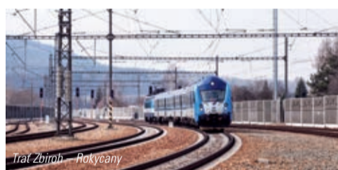
Trat Zbiroh – Rokycany

V sekci aktuality na www.subterra.cz je odkaz na videoreportáž z udílení cen.