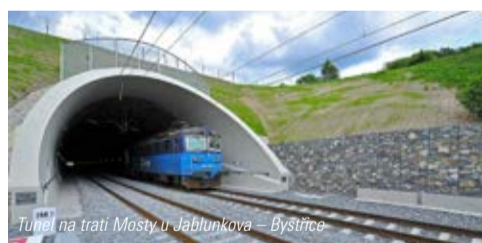
Tunel na trati Mosty u Jablunkova – Bystřice