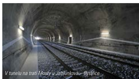
V tunelu na trati Mosty u Jablunkova – Bystřice